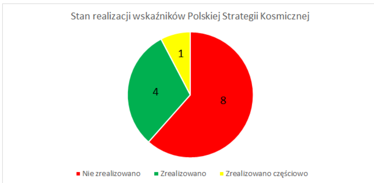
Rycina 2. Stan realizacji wskaźników Polskiej Strategii Kosmicznej

Na podstawie przeprowadzonej analizy można stwierdzić, że na 13 wskaźników przewidzianych w PSK do realizacji do roku 2020 zrealizowano 4 wskaźniki. Częściowo zrealizowano 1 wskaźnik, a 8 wskaźników nie zrealizowano. Jeden z 4 wskaźników, które udało się zrealizować – „Rozwinięty program staży i praktyk w firmach kosmicznych” – został zrealizowany jeszcze przed przyjęciem PSK.